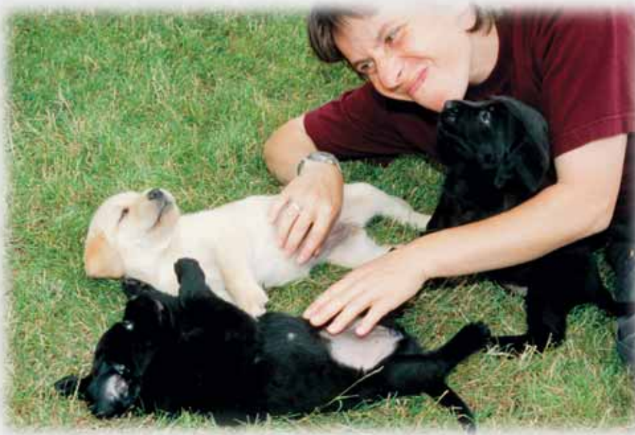
Die Aufrichtigkeit innerer Zuwendung des menschlichen Fürsorgegaranten und seine Feinfühligkeit im Erkennen und Erfüllen der natürlichen Bedürfnisse des Welpen ist die Grundlage für eine gelingende Verhaltens- und Wesensentwicklung.

Anhand des aufgezeigten Beispiels lässt sich schon bei erster grober Betrachtung feststellen, dass es dem Welpen möglich war, durch eigenes Tun etwas zu bewirken und dabei an-