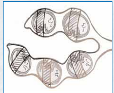
Auch vorgeburtliche Einflüsse können weitreichende Wirkungen auf die Aktivität der Gene haben. Illustration: A. Weidt 2006

Versucht man nun dazu die Gesetzmässigkeiten der Natur zu verstehen, so wird ihre Genialität geradezu schlagartig deutlich: In einer Umwelt, die massiven unbewältigbaren Stress für ein Muttertier darstellt, macht es keinen biologischen Sinn, Nachwuchs zu haben. Der Nachwuchs kommt deshalb dort nicht weiter