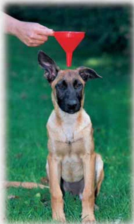
Zur Entwicklung eines sicheren Wesens braucht es keinen Trichter, sondern die richtigen inneren und äusseren Voraussetzungen.

Eine elementare und vielfältig wirksame Grundlage der Lebensbewältigung heisst emotionale Sicherheit . Sie entsteht beim Hund