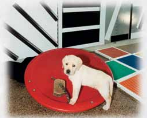
Durch eigenes Tun etwas zu bewirken fördert immer wieder neu den Antrieb zur positiven Lebensbewältigung.

Der Welpen wird in vorsichtiger Zurückhaltung dieses bisher unbekannte Objekt beschnuppern und es irgendwann mit seinen Pfoten erkunden, vielleicht auch nur zufällig berühren. Die dadurch ausgelösten Wackelbewegungen stellen sich für ihn wie eine Antwort auf sein vorausgegangenes Tun dar und erwecken vielleicht mit etwas Verzögerung erneut und eventuell noch etwas intensiver seine Neugier. Das kann sich mehrfach hintereinander, mit oder ohne zeitliche Abstände wiederholen. Diesem Wiederholen liegt gewissermassen die Strategie zugrunde, herauszufinden, ob dieses Objekt wirklich gefahrlos und das Geschehen nur zufällig ist oder einer gewissen „Logik“ unterliegt. Irgendwann wird sich der Neugier- und Erkundungsdrang gegenüber der Angst vor Unbekanntem so weit durchsetzen, dass dieses immer noch relativ unbekannte Objekt erklommen und darauf Fortbewegungen ver-